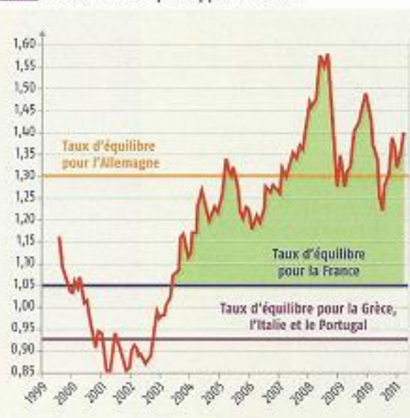
DOC 3 Valeur de l'euro par rapport au dollar

DOC 1 Un vent de protectionnisme souffle au pays du libre-échange. Le Sénat américain a en effet voté cette nuit en faveur d'un texte de loi visant à mettre en place des droits de douanes supplémentaires pour les produits importés des pays qui pratiquent le dumping monétaire. La Chine est clairement dans le viseur des parlementaires. Les responsables politiques américains estiment en effet que le yuan est maintenu faible par Pékin, pour gonfler ses exportations. Selon eux, cette politique permettrait aux marchandises chinoises d'afficher un avantage compétitif de 30% par rapport aux produits américains. Un mécanisme qui, selon les parlementaires américains, est susceptible de détruire des emplois Outre-Atlantique. Le président de la banque centrale américaine, Ben Bernanke, affirme lui aussi que « la politique de change chinoise pénalise le processus de reprise ». Les partisans du texte soulignent donc que ce projet de loi profiterait à l'économie américaine où le taux de chômage culmine à 9,1%. Barack Obama a récemment accusé la Chine de « fausser le système des échanges commerciaux à son avantage et aux dépens d'autres pays, en particulier les États-Unis », en intervenant pour faire baisser la valeur du yuan.